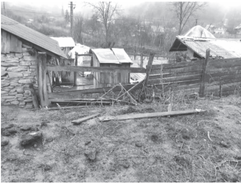
Nem okoz gondot a nagyvadnak, hogy bejusson a gazdaságokba

ugyanazon a hétvégén tört be éjszaka két gazdaságba a nagyvad, vélhetően ugyanaz az állat. Az egyik helyen 11 tyúkot pusztított el, de ennél jóval nagyobb kárt okozott a másik helyen, ahol 35 baromfi esett áldozatul – avatott be a részletekbe Benedekfi Csaba polgármester, aki elmondta: a náluk idén iktatott 10 kérvényből csupán kettőre ítétek meg kártérítést a gazdának. Információink szerint a szomszédos Márkodban is „látogatást tett” a medve ugyanazokban a napokban, de senki nem jelentett be kárt.