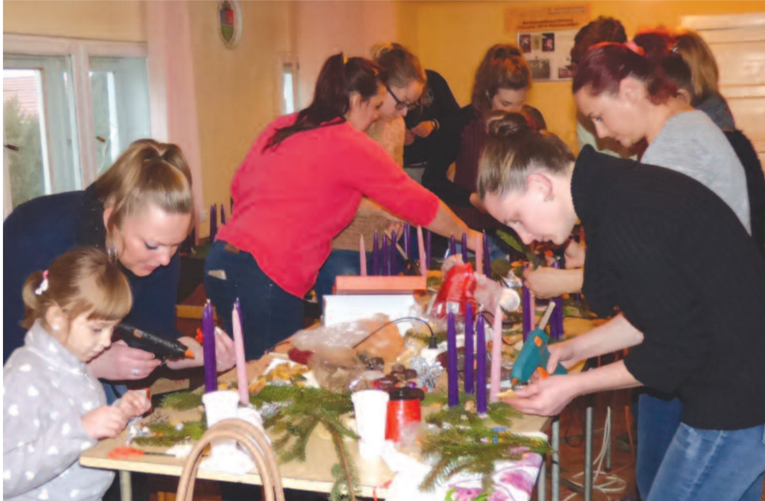
Nemes céllal, jó hangulatban dolgoztak a madarasi fiatalok