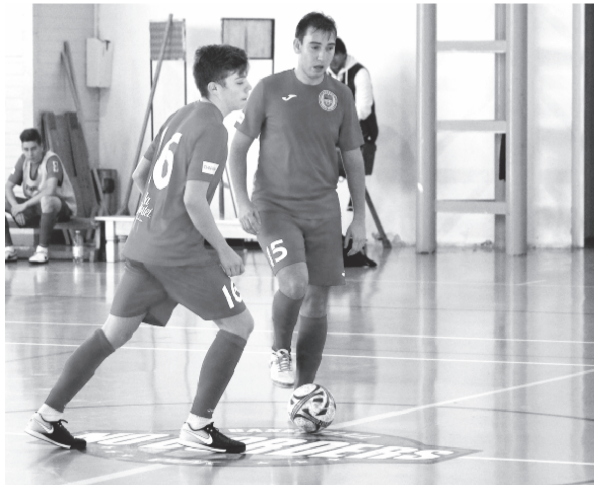
Középkézre készülődnek a City'us játékosai – az utóbbi időben megszokott momentum az a mérkőzéseiknek.