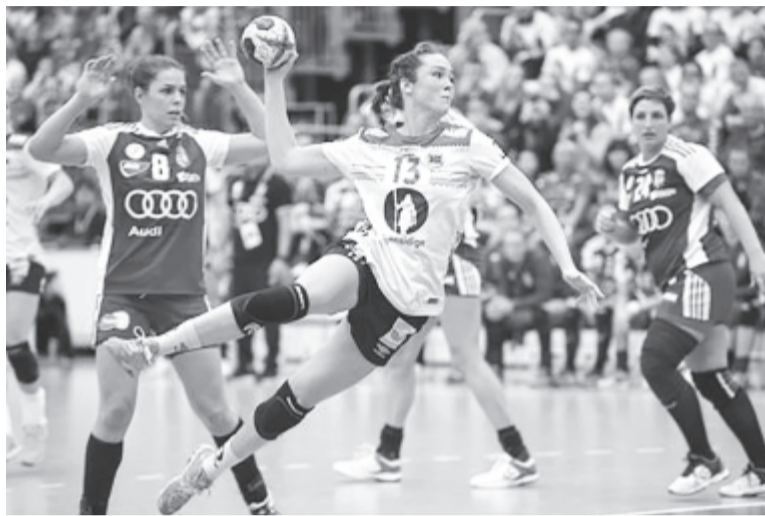
Feltartott kézzel: a norvégok minden állásból szórták a gólokat

A két csapat 81. alkalommal találkozott egymással, 49 magyar győzelem és három döntetlen mellett ez volt a 29. norvég siker.