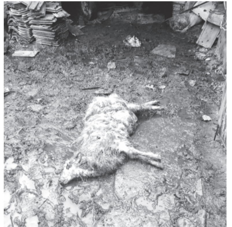
Elfogyott a mezőről a gabona, most a háziszárnyasok és juhok között végez pusztítást a medve

A medvék már Nyárádszereda utcáin is megjelentek: egyik a polgármester utcáját kereste fel, míg egy másik egy derék polgárra ijesztett rá alaposan a sötétben a település egy másik részén. De Jobbágyfalva felé is állta el már a vad az emberek útját: a nyáron egy nászmenetet tartóztatott fel, de nem azért, hogy tréfás kérdéseket tegyen fel nekik, hanem hogy nyugodtan elfogyaszthassa a közeli kukoricásból származó eledelét, mielőtt továbbállt volna. Egy hajnalban pedig egy munkásokat szállító autóbussz kergetett meg néhány száz méteren egy medvét, hogy a mögötte kerékpáron érkező személyek biztonságban tudjanak eljutni Nyárádszeredába. A kisváros fölötti vízüzem és gát környéke a horgászok kedvelt helye volt még nemrégiben, de lassan kiszorítja őket innen a folyóvízre lejáró bundás – panaszolták el az érintettek.